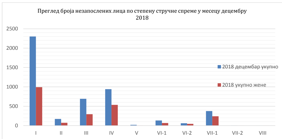
Графикон 1. Преглед броја незапослених лица по степену стручне спреме у месецу децембру 2018.

У односу на 2017. годину, структура незапослених лица према степену стручне спреме је готово иста, тако највише има лица са I степеном стручне спреме 2.302 (48,98%), затим са IV степеном 940 (20%), са III степеном 692 (14,72%), са VII-1 степеном стручне спреме је 376 лица (8%), са II степеном 172 лица (3,66%), са VI-1 степеном стручне спреме је 131 лица (2,78%), са VI-2 степеном стручне спреме је 60 лица (1,28%), број лица са V степеном стручне спреме 20 (0,42%), са VII-2 степеном стручне спреме је 6 лица (0,13%), и са VIII степеном стручне спреме 1 лице (0,02%).