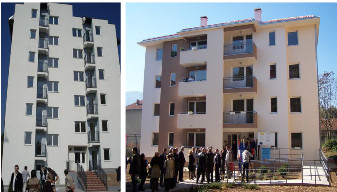
Фотографије: Стамбене зграде у насељу Севојно

Савет за миграције је после разматрања ситуације са локалним капацитетима заједнице, стањем са терена и извештајима надлежних органа усвојило став да се евентуални појединачни случајеви миграната и тражилаца азила решавају кроз прописане процедуре, а да се та лица одмах затим транспортују до званичних центара за смештај у Републици.