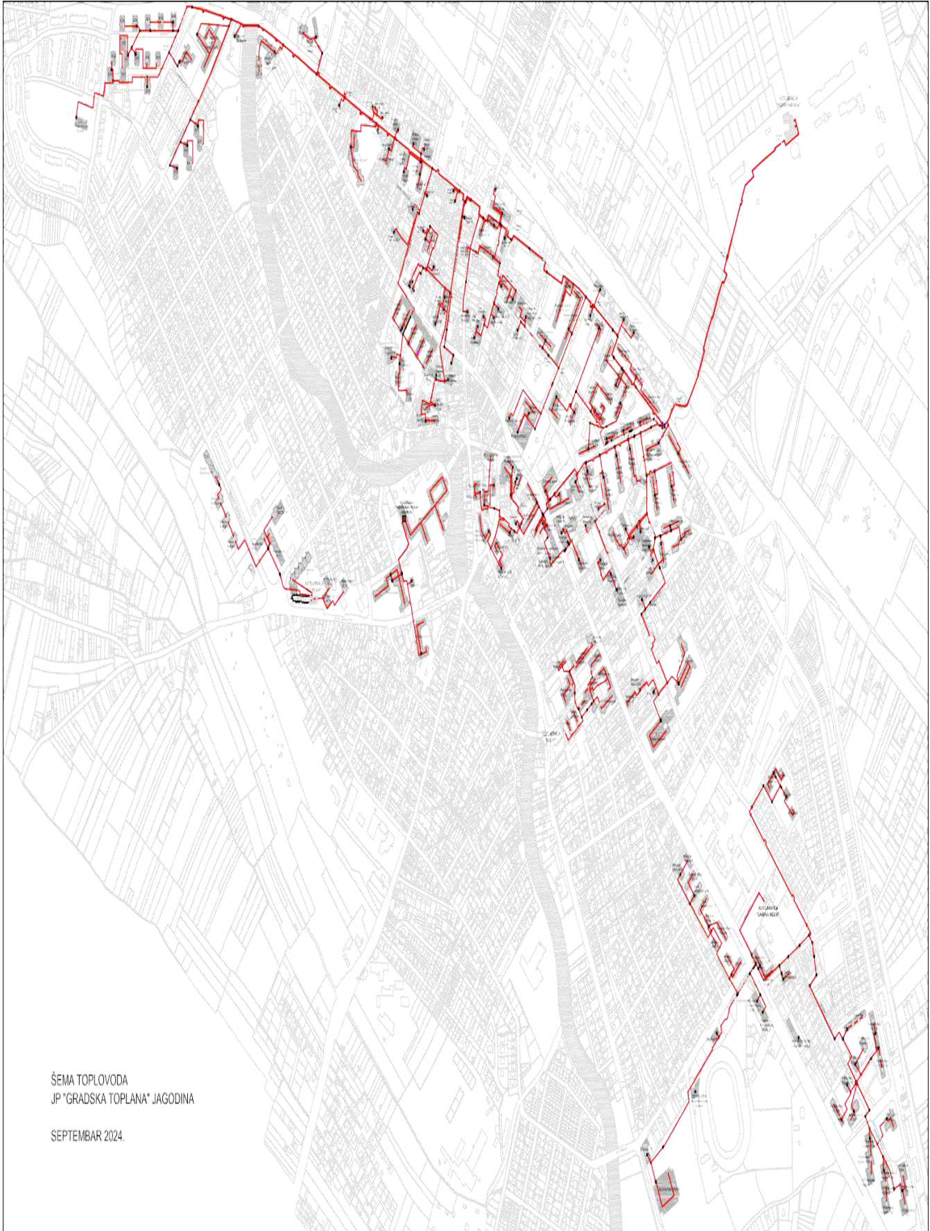
ŠEMA TOPLOVOĐA JP "GRADSKA TOPLANA" JAGODINA SEPTEMBAR 2024.