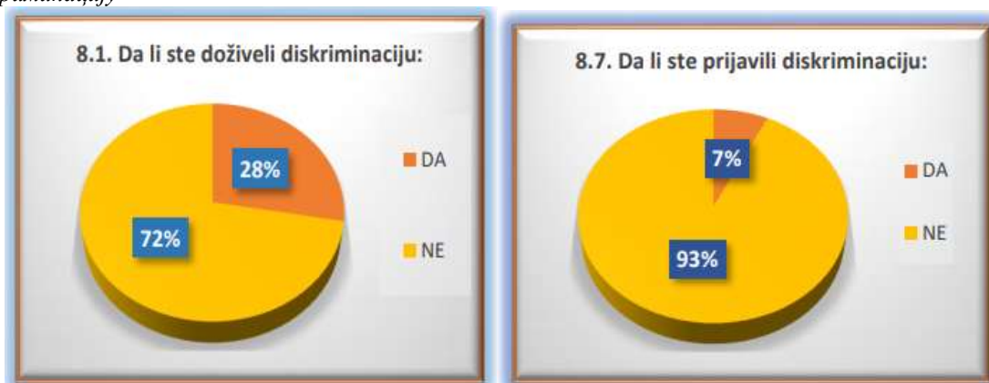
Табеле 35 и 36: Удео испитаника који је доживео дискриминацију и оних који су пријавили дискриминацију

Извор: Анализа истраживања „Знањем до посла“, Удружење „Рома центар“, Крагујевац