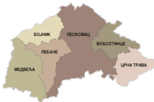
Слика 2: Положај града Лесковца у Јабланичком округу