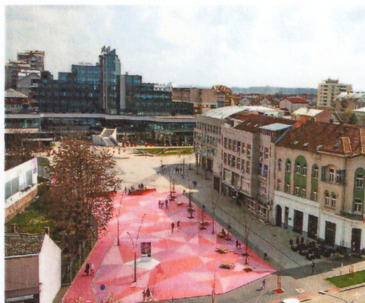
Слика 7 и 8. Трг Шабачких жртава