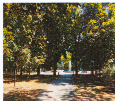
Слика 4. Фонтана у центру парка