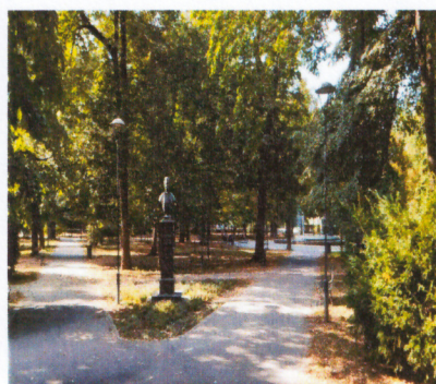
Слика 3. Биста Ј. Веселиновић