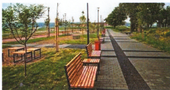
Слика 12 и 13. Савска авенија