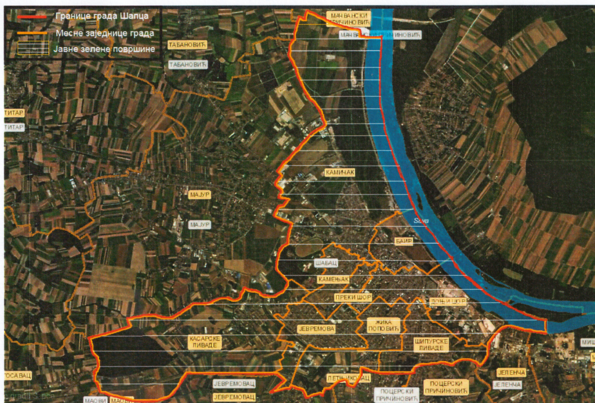
Слика 1. Територија града Шапца и јавне зелене површине

Саставни део Сепарата је графички приказ јавних зелених површина на територији града Шапца.