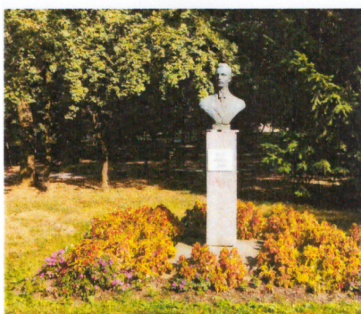
Слика 2. Биста К.Абрашевић