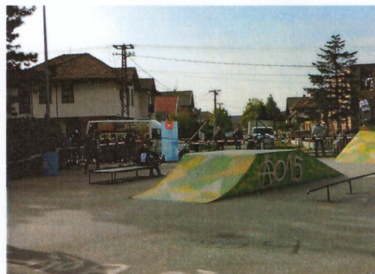
Слика 6. Скејт парк на Живинарнику