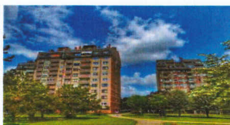
Слика 9 и 10. Стамбено насеље Тркалиште

Назив зелених површина блоквског зеленила приказан је у табели: