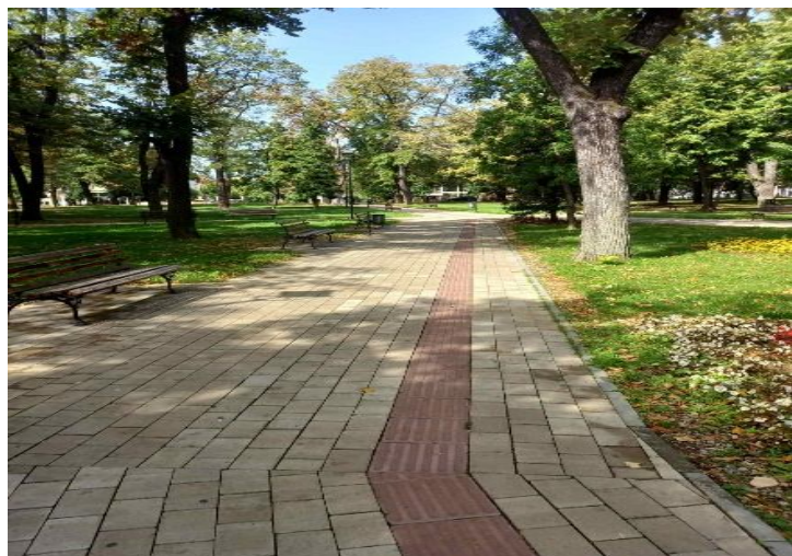
Слика 1 – Градски парк

Градски парк је у програму редовног одржавања ЈКП „Комрад“ Врање, које, између осталог, обухвата одржавање зеленила (редовно подмлађивање – трула, стара и оштећена стабла се замењују младим аутохтоним садницама, ручно окопавање и друго), кошење травњака, сакупљање папира, пражњење корпи за отпатке и друго.