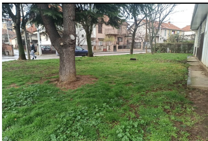
Слика 2 – Парк код I Месне заједнице

Парк код I Месне заједнице заузима површину од 2200м 2 . У саставу парка налази се ограђено дечје игралиште, пешчаник у травнатом делу, пешачке стазе, 1 чесма, кошаркашки терен и парковски мобилијар. Што се тиче зеленила, постоји око 95 стабала дрвећа, како четинарских тако и лишћарских, 13 садница шибља и око 40 садница ружа. Од дрвенастих врста су најзаступљени су јавор, јасен и липа.