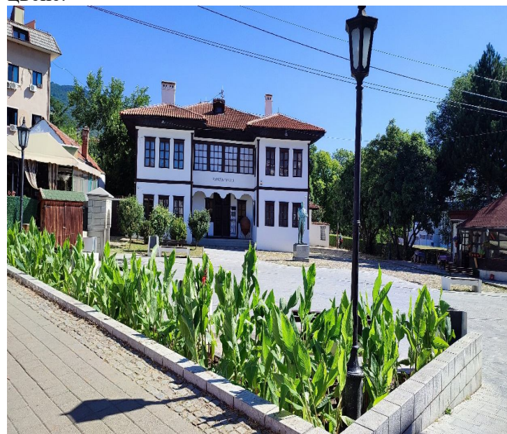
Слика 3 – Трг Станише Стошић

налази се у центру града, а озелењени простор заузима површину од 36 м 2 . Од садница дрвенастих врста присутна је шаренолисна јапанска врста ( Salix integra ) и жбунасте врсте од којих преовлађује шимшир ( Vuxus ). По потреби се сади и сезонско цвеће.