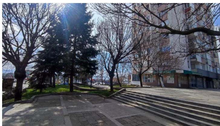
Слике 12 и 13 – Трг братства и јединства Линијско зеленило – дрвореди

Дрвореди су формирани дуж тротоара, паркинг простора у регулацији саобраћајница и самосталних површина за паркирање где је посађено преко 2200 садница лишћарских и четинарских врста. ЈКП „Комрад“ одржава следеће дрвореде: